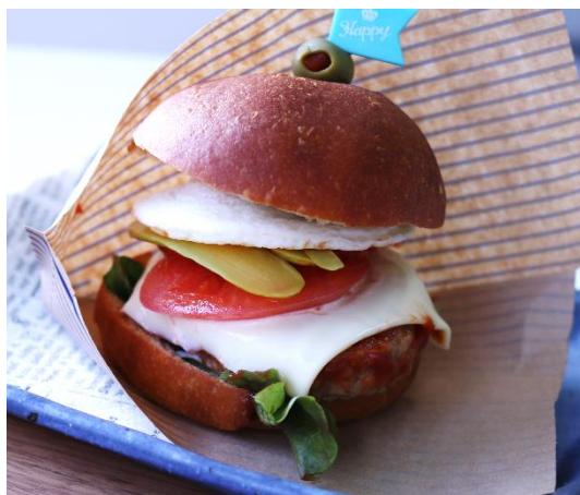
ブランパンのハンバーガー これも低糖食!? 4月4回コースでの実食メニュー