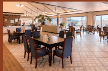
調度品にもこだわったレストラン