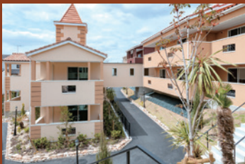
15棟のコテージが連なるフィレンツェの町並み