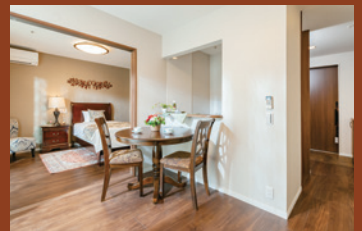
理想のライフスタイルに合わせて選べる多彩な居室プラン